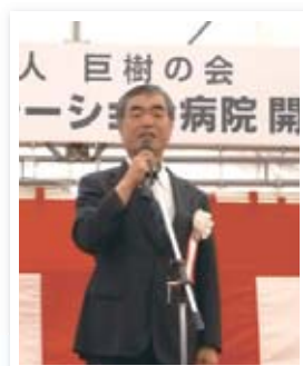
小金井リハビリテーション病院 リハビリテーション科