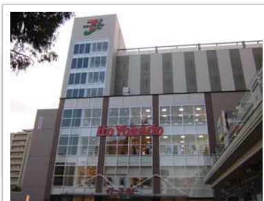
イトーヨーカドー