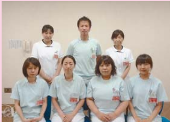
■ 小金井リハビリテーション病院 医療連携室 TEL 042-316-3100(直通)